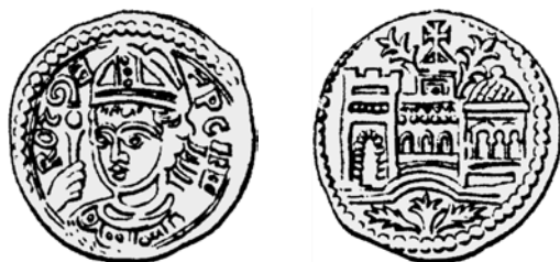
Luik, Rudolf van Zaeringen, denarius (Vanhoudt G 802)