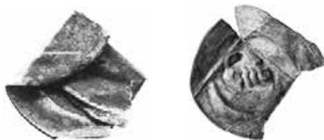
Sankt Gallen, angster. Begin vijftiende eeuw, zilver, circa 18 mm. Tweedubbel gevouwen, gevonden in de kerk van Steffisburg in Zwitserland. Foto's voor en na het uitvouwen 10

Het verschijnsel kan natuurlijk ook onderzocht worden aan de hand van muntvondsten. Een enkele maal komen bij kerkopgravingen ook onmiskenbaar opzettelijk gevouwen munten tevoorschijn. Zo zijn bij verschillende opgravingen