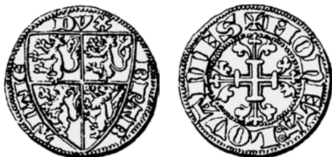
Brabant, Jan III, sterling uit Leuven (Vanhoudt G 257)